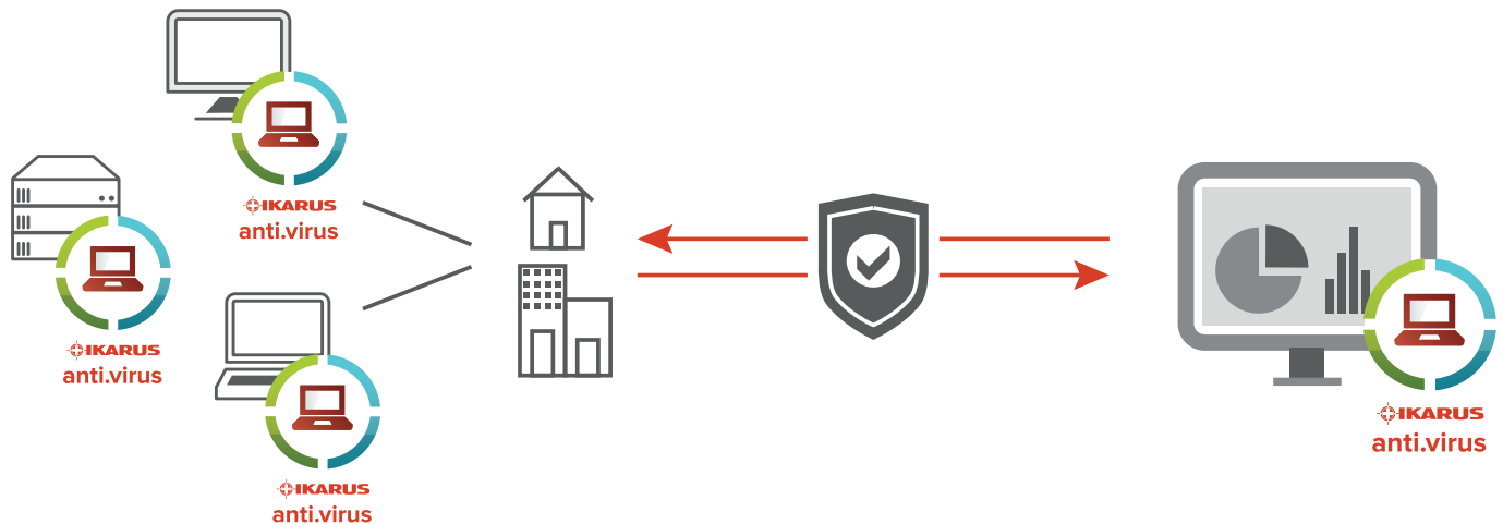
Abb. 1 - IKARUS anti.virus in the cloud schützt Laptops, Desktops und Server vor gefährlichen Programmen und unerwünschten Eindringlingen. Die Software kann direkt am Endgerät oder über ein Web-Interface gesteuert werden.

Die Kommunikation läuft abgesichert über das Internet und damit unabhängig von den Standorten der verwalteten Geräte. Für das IKARUS anti.virus Portal fallen weder zusätzlichen Lizenzkosten noch Aufwände für Installation, Update oder Wartung an.