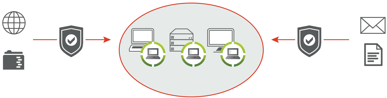
Abb. 1 - IKARUS anti.virus schützt Windows Workstations und Server vor gefährlichen Programmen oder unerwünschten Eindringlingen.